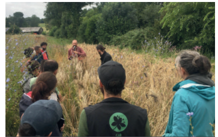
Journée blés paysans.