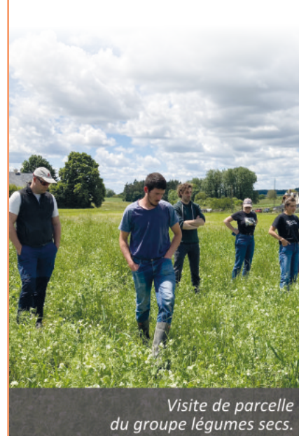
Visite de parcelle du groupe légumes secs.