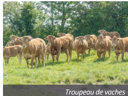
Troupeau de vaches

Finalement, sur les 104 fermes éligibles, seules 33 sont prioritaires (11 en 100 % herbe et 22 avec des jeunes agriculteurs et agricultrices). L'instruction des