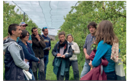
Formation lutte biologique en arboriculture, mai 2024, à Orée-d'Anjou