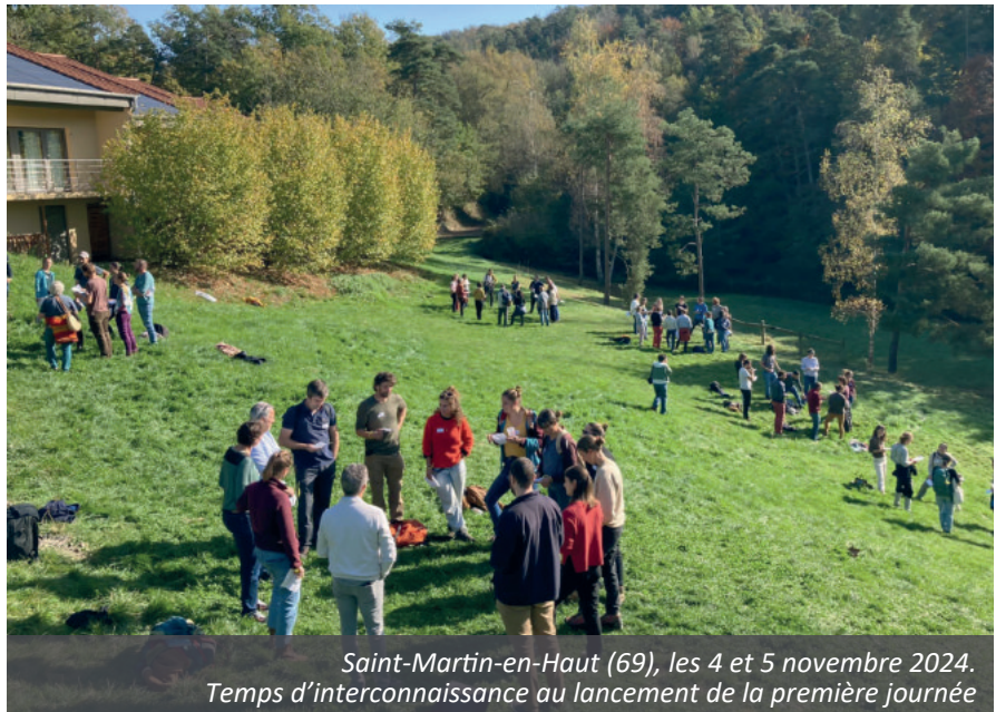
Saint-Martin-en-Haut (69), les 4 et 5 novembre 2024. Temps d'interconnaissance au lancement de la première journée

« Ce colloque nous a oxygénés, autant techniquement qu'humainement. Dans notre groupe, il y aura un avant et un après. Nous comptons accueillir dès 2025 les producteurs et productrices du Rhône, d'Ardèche et de Haute-Loire sur nos fermes. Ces prochaines rencontres permettront peut-être d'avoir des travaux communs, par exemple sur l'utilisation de PNPP, ou d'obtenir des données technico-économiques. »